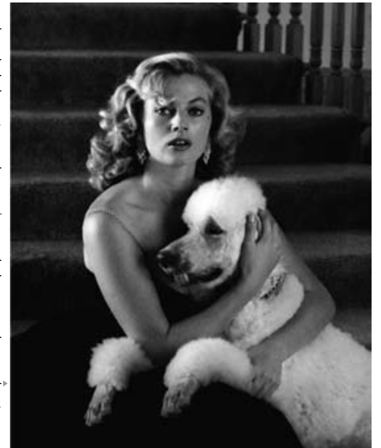
André de Dienes: Anita Ekberg (1955 k.), ezüst vintage

Szakmai berkekben nem kell külön bemutatnunk Bécsben, a Nyugati pályaudvar közelében székelő WestLicht galériáját, amely az időszakos tárlatok mellett rendszeresen tart árveréseket is. Legutóbb május 29-én a 17. Photographica aukció 213 válogatott képét elegáns, párhuzamosan német és angol nyelvű katalógus kísérte, a reprodukciókat kísérő szöveges elemzéseken kívül külön közölt, precíz életrajzokkal.