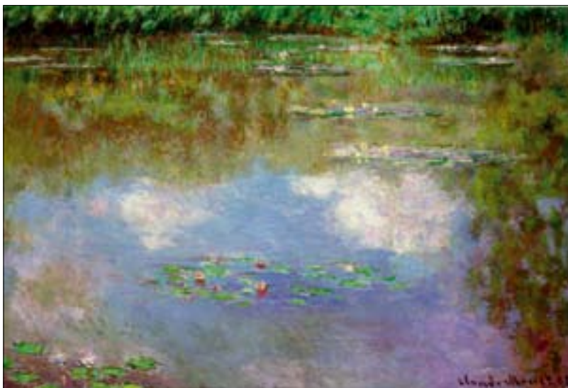
Claude Monet: Vízililiomok (A felhők) című festménye, 1903-ból. Monet, a színek és formák, a vízfelületek és reflexiók avatott mestere kertjének jellegzetes részletéről grandiózus méretű sorozatot festett. Érdeemes fotós szemmel is tanulmányozni a képeit.

A tükörkép képe a kedvelt fotografiai motívumok között szerepel már jó ideje. Nem véletlenül és nem érdemtelenül. A tükröződések nemcsak formailag teremthetnek meglepőt és újszerűt a kreatív fényképész jóvoltából, hanem a képet gyakran sejtelmesebbé, többértelművé, elvontabbá s ezzel mélyebb tartalmakat tükrözővé tehetik. Az is igaz, hogy a tükörkép mint motívum meglehetősen elhasználódott már, így aztán könnyen téved a tájékozatlan fotós az ismétlő epigonizmus mezejére. Két szerzőnk kétféle szempontból igyekszik ötleteket adni ahhoz, hogyan lehet újat és jót teremteni a tükörképpel.