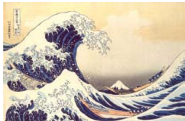
Hokusai Katsushika: A nagy hullám Kanagawánál (a Fuji harminchat látképe sorozatból), 1831

A tagadó válasz mellett érveket gyakran a „szép” természet harmóniája szolgáltatja már több mint két évszázada. Ám a rousseau-i szemléletet követők olyan természetet sírnak vissza, amelyik sosem volt. Nem a vadállatok és haramiák miatt életveszélyes hatalmas európai őserdőket, a betegségeket terjesztő, büzlő mocsarakat sajnálják, nem a viharos tengereken elsüllyedt gályákra gondolnak, sem