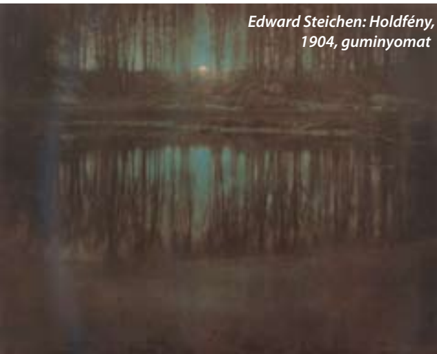
Edward Steichen: Holdfény, 1904, guminyomat

A szelídített, „kezes táj zsebre vágva” nem más, mint a kert. Kultúrája több évszázados, s a leginkább iparosodó, természetes tájait szinte teljesen elvesztítő Angliában virágzik a mai napig tán a legelenebben. Minél kevesebb a természetes zöldfelület, annál inkább vágyunk legalább egy cserép „kezes” virágra a balkonon. Nem véletlen, hogy az angol festők folytatják a németalföldi hagyományt. Annak az Angliának a festői, amelyik a sztratoszféra máig ható pusztítását kezdi el dicsőséges ipari forradalmával. Ki a szabadba! Constable, Turner nem győz gyönyörködni a tájban, s az ő nyomdokaikon a fény és a természetesség fotósa, Emerson is. Lankák és erdők, tiszta, vakító napfény, felhők és tágasság, végtelen horizontok, angol parasztok bukolikus látványa. Az európai ember meghatóttan gyönyörködik mindabban, amit éppen szisztematikusan pusztít.