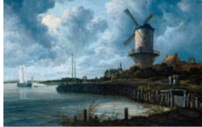
Jacob van Ruisdael: Szélmalom, Duurstede, 1670

nak és (döntően kényszerből) utazónak egyaránt. A XVII. századi Németalföld polgárai kerültek tán először kulturálisan olyan távolságba az addigi természetes környezettől, hogy friss szemmel, kívülállóként tekintettek rá. Az elkövetkező évszázad, a XVIII. pedig már szinte az egész civilizált világban a természet s a természetes iránti rajongás jegyében telt. Észreveszik hát az emberek a tájat nem termőföldként, nem lehetséges legelőként, nem tervezett kastély helyszínként, hanem önértéket, önszépséget tulajdonítva neki. Rousseau ki is mondja a kissé körvonalazatlan érzést, szavakba foglalja az elvesztett természetesség iránt érzett nosztalgiát. Az emberek érzékenyebb része pedig szinte fuldoklik az egyre művibb világban. S napjainkig érvényes az akkori megfogalmazott dilemma a civilizáció megítéléséről. Boldogabb lett-e az ember attól, hogy már nem a „vadság” korában él?