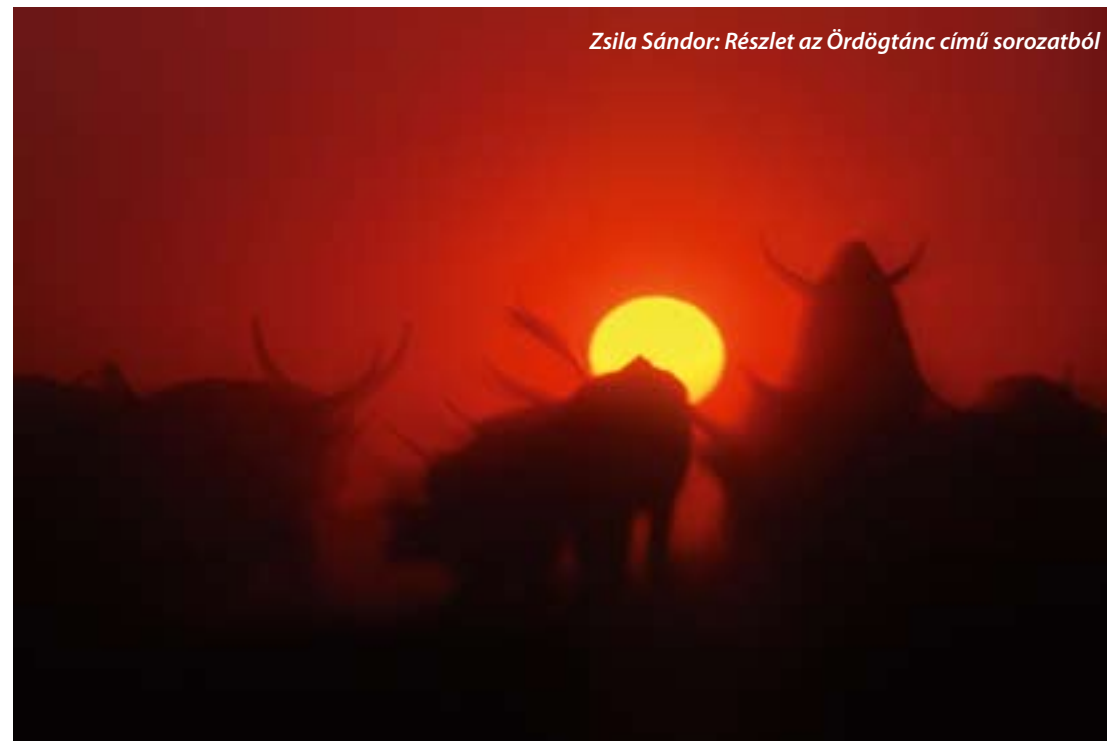
Zsila Sándor: Részlet az Ördögtánc című sorozatból

Sebastião Salgado, a nagy brazil fotóművész, aki egész életében az embereket s az emberi civilizációt örökítette meg, pár éve, hatvanévesen tájat és természetet kezdett fotografálni. Fotóin a természet mint kuriózum jelenik meg; szép és szomorú állatok, védtelen tájak. A világ, az egykor volt édenkert, mára lerabolt, bemocskolt, színtelen, pusztuló szeméttelép. Nem elképzelhető, hogy ez a megrendítő sorozat lesz a tájfotó történetének záró fejezete.